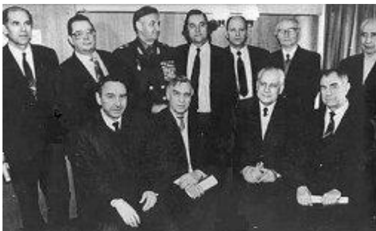
Члены Государственного комитета по спасению Советского Союза от развала

Двадцатого столетия герои! Вы приняли неравный бой, чтобы отвести удар коварной Прорвы, нависший над советскою страной! Как рано оторвали крылья, Как рано факел ваш угас, Но далеки не вы от народа были, Народ был слишком далеко от вас! Декабристы двадцатого столетья! О вашем подвиге не умрет молва Поражение, равносильное победе, Отозвалось вершиной торжества!