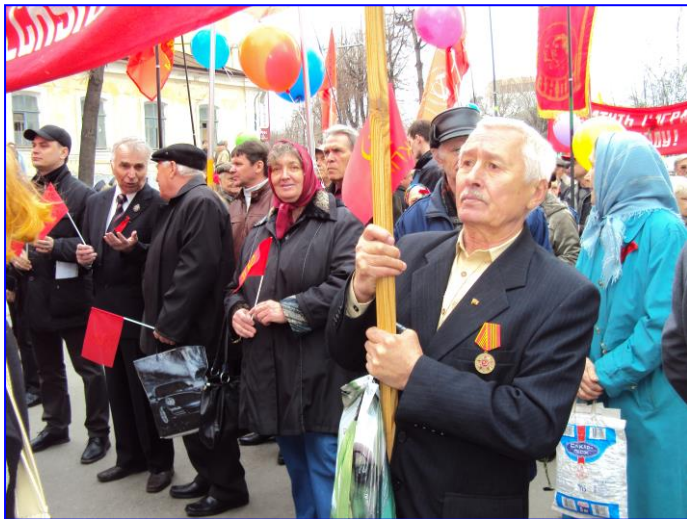
Коммунисты Ульяновского района в рядах демонстрантов Ульяновск. Площадь В.И.Ленина. 1 Мая 2010 года.