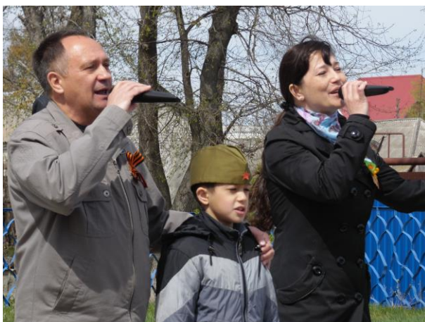
ЗВУЧИТ ПЕСНЯ «КАТЮША»