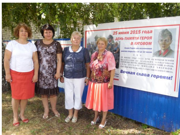
Делегация администрации города Ульяновска