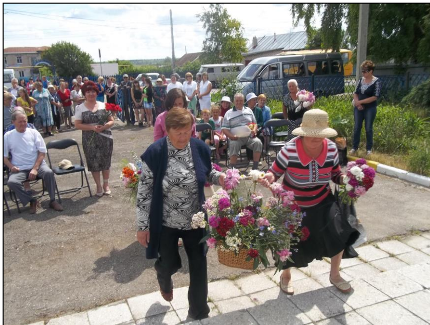
25 июня 2015 года прошел День памяти героя, посвященный 70-летию подвига Героя Советского Союза Михаила Хваткова