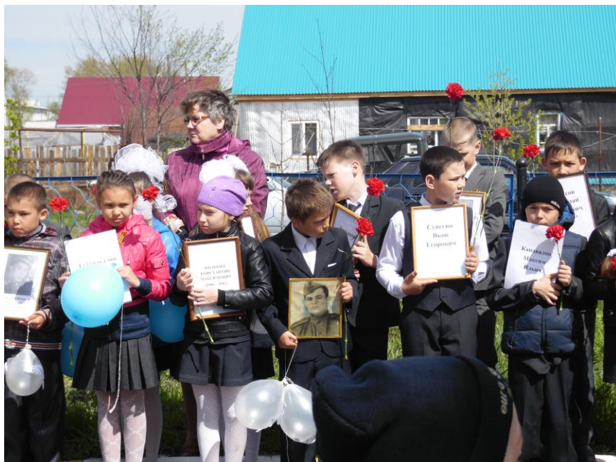
Бессмертный полк в строю