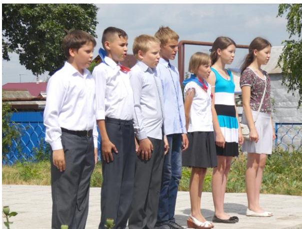
Выступают семиклассники Луговской школы