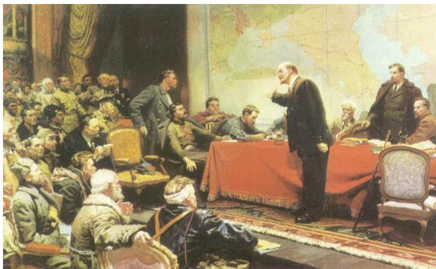
Ленин у карты ГОЭЛРО

Ленин к коммунизму, как к общественному феномену, подходил с разных сторон. Конечно, в центре были производительные силы. «Коммунизм есть советская власть плюс электрификация всей страны».