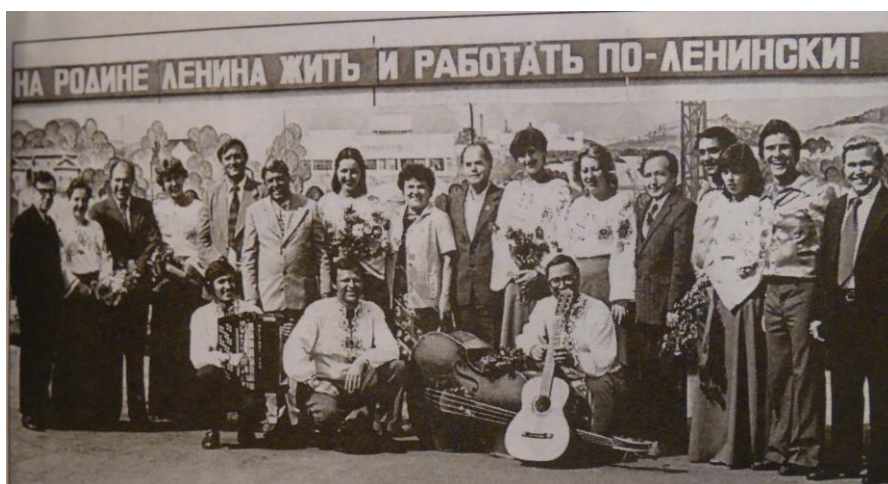
Руководители района встречают посланцев Украины на площади Дружбы в р.п.Ишеевка Июнь 1982 года