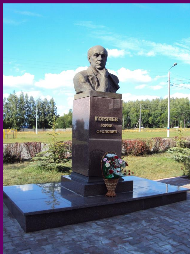
Памятник Юрию Фроловичу Горячеву в р.п.Ишеевка