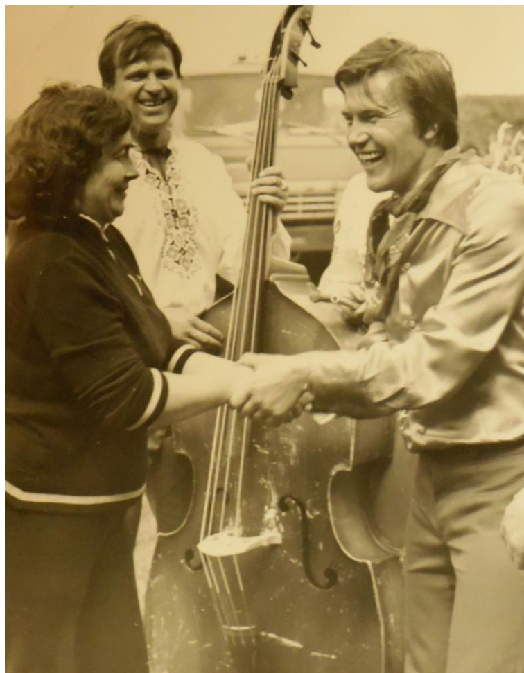
Родина Ленина встречает посланцев братского народа