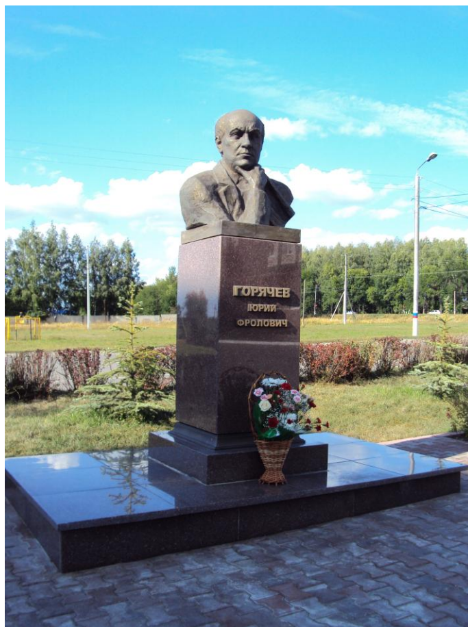
Памятник Юрию Горячеву в Ишеевке