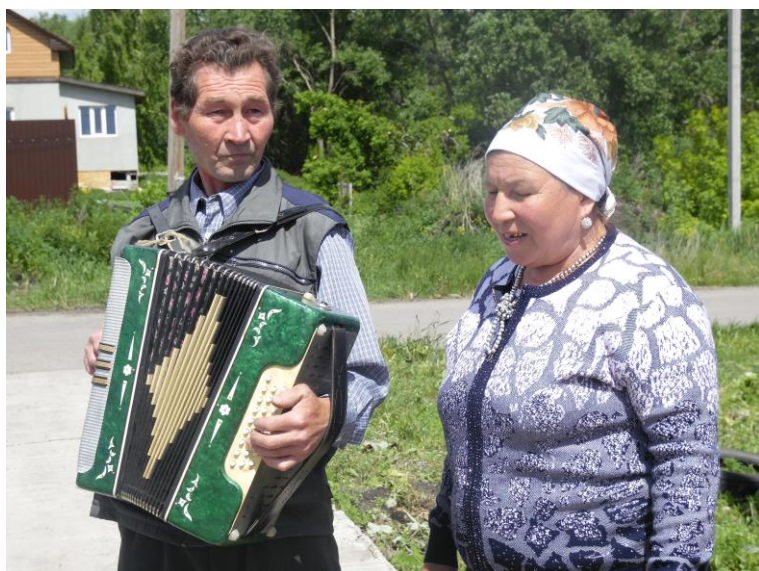
Звучит татарская песня в исполнении Фирдуси Сагдеевой