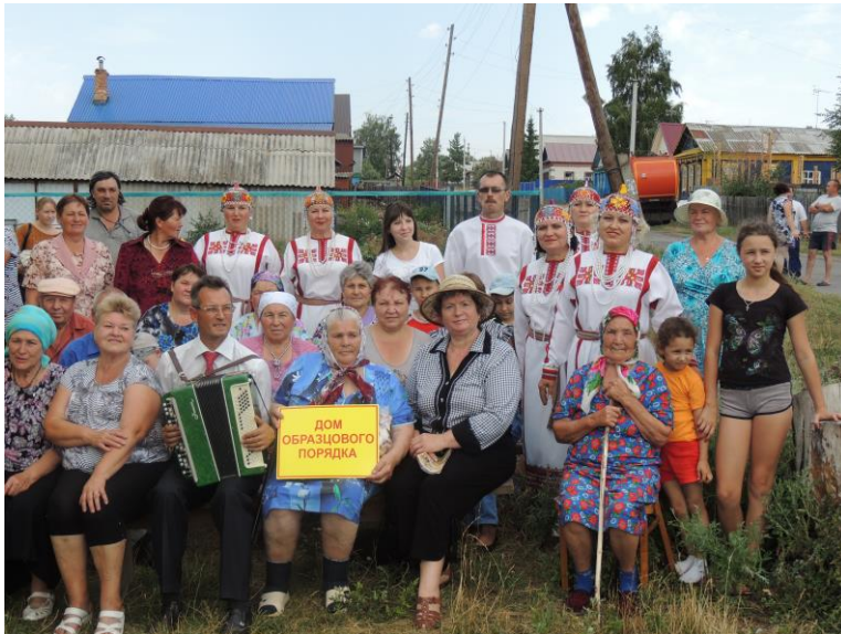
Праздник детей войны. 21 июня 2014 года