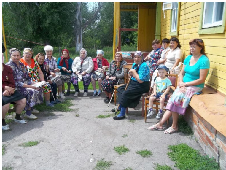
Праздник детей войны. 21 июня 2014 года