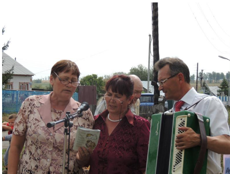
Праздник детей войны. 21 июня 2014 года