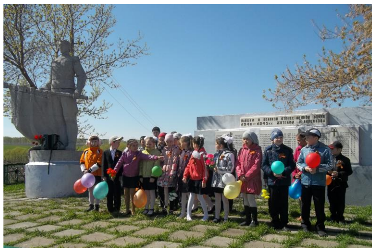
День Победы в селе Анненково. 2014 год