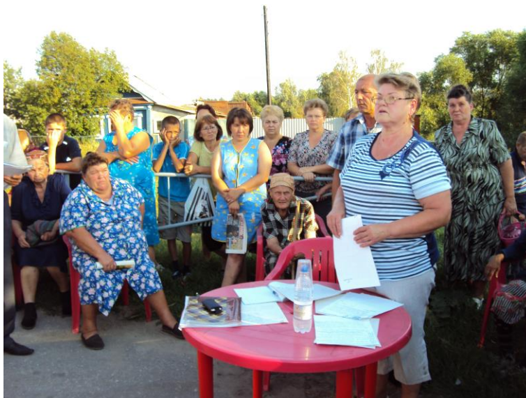
Сход сельской общины. 30 августа 2011 года