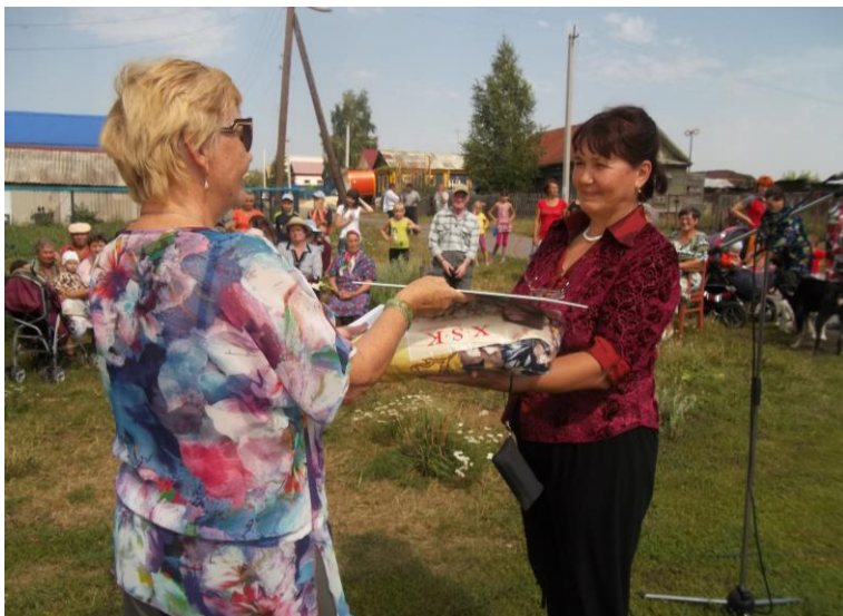
Вручение приза победителям конкурса «Дом образцового порядка»