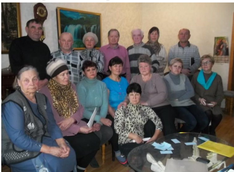
Активисты села. 18 декабря 2014 года