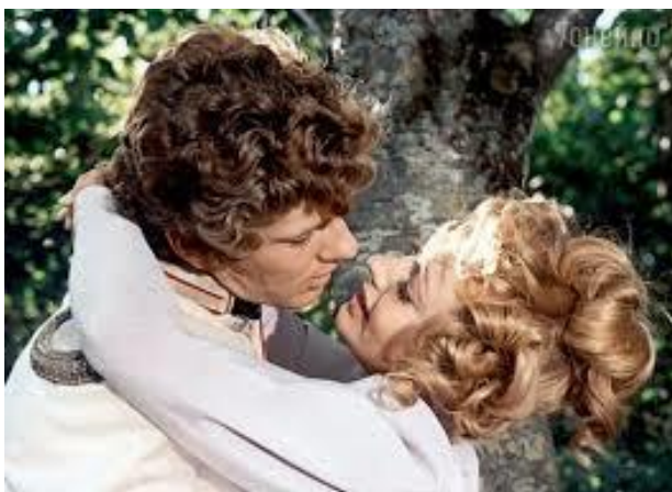
Кадры из фильма «Звезда пленительного счастья».

Архангельской церкви, она венчается с Иваном Александровичем. Только на время венчания с жениха были сняты кандалы.