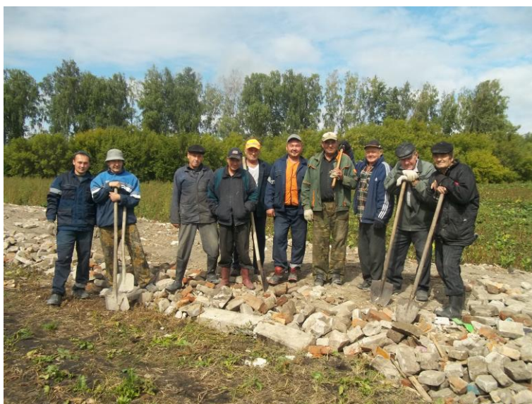
Субботник по благоустройству дороги на кладбище 30 августа 2014 года