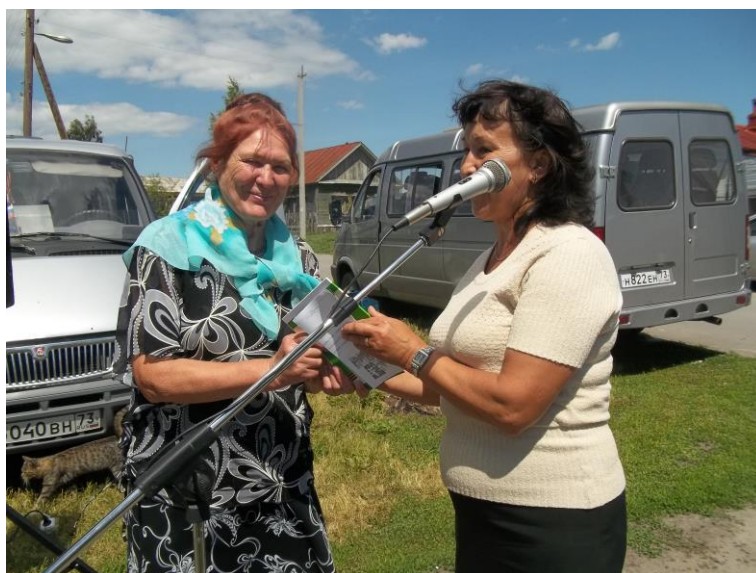
Праздник детей войны. 21 июня 2014 года